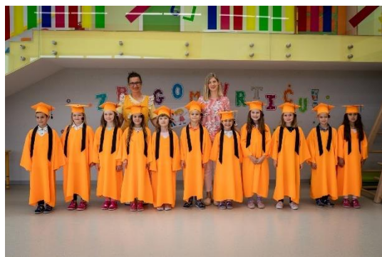
Polaznici programa predškole integriranog u redovan program DV Potočić Belajske Poljice 2022./2023.

Program predškole nije priprema za školu i osposobljavanje za prihvaćanje budućih školskih obaveza nego osiguravanje kontinuiteta u odgoju i obrazovanju djece i povezivanju dvaju sustava da bi se svakom pojedinom djetetu osigurao primjeren proces izgradnje kompetentnog i odgovornog čovjeka.