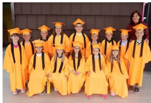
Polaznici programa predškole koji nisu uključeni u redovan program DV Potočić Belajske Poljice 2022./2023